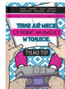
książeczka zamiast scrollowania na kibelku