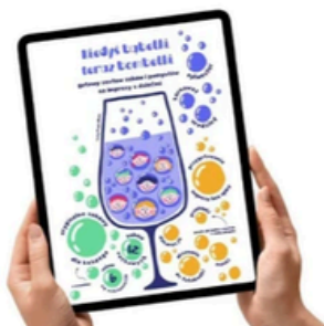
pomysły na imprezę z dziećmi od A do Z

A JEŚLI SZUKACIE SPOSOBU NA NUDE, ZOBACZ CO KUPUJĄ INNI